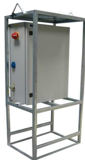
Armoire Pieds de Grue Générale chantier