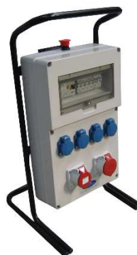
Coffrets Tous Corps d'Etats