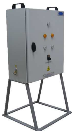
Coffret Inverseur de sources