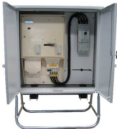
Armoire Tarif Jaune